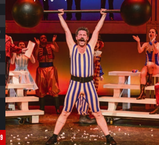
Velká ryba (Big Fish)

■ Děníera ■ Veřejná generálka ■ Premiéra