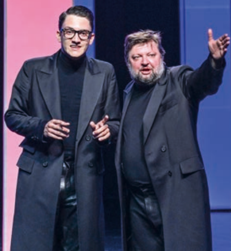
Hamlet aneb Hádala se duše s tělem

■ Děníera ■ Veřejná generálka ■ Premiéra