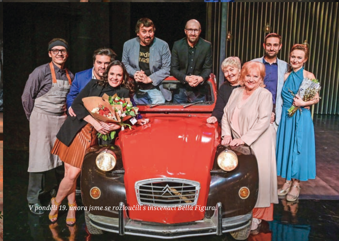
V pondělí 19. února jsme se rozloučili s inscenací Bella Figura.